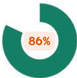
Taux de réussite certifications RS ou RNCP*