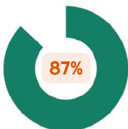
Taux d'insertion dans l'emploi après certification RS ou RNCP*